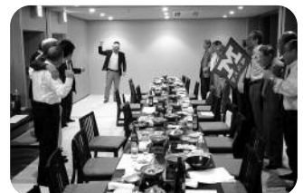
参加者全員で校歌斉唱