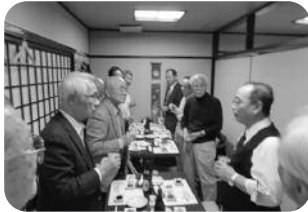
参加者全員で乾杯

東の会が11月14日、「うなぎ処柳川屋博多駅前店」で行われました。開始時間のかなり前より乾杯の練習が進んでおられ、盛り上がるのに時間はかかりません。