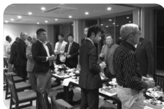
参加者全員で乾杯