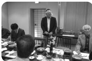
片岸校友自己紹介