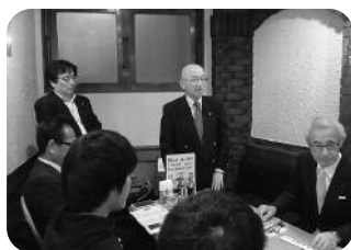
矢谷福岡市地域支部長のご挨拶