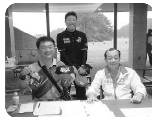
鈴木幹事長・女賀校友・安心院校友受付の様子