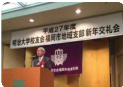
絹笠名譽支部長のご挨拶