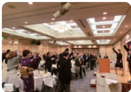
福男・福女を決めるジャンケン大会