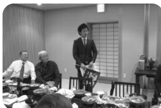
小杉校友自己紹介