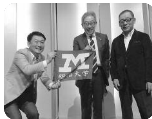
女賀校友・松本校友、慶應大学校友と共に