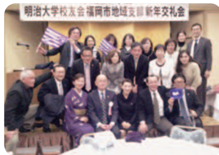
伊藤みどり氏を囲んで記念撮影