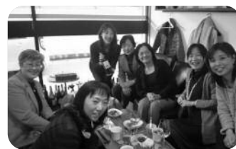
全員笑顔でハイポーズ

健康の話にも花が咲き、やっぱり運動せないかん！と結論がでました。皆さんイキイキとしていて、羨ましい限り。それに比べて私は？反省しきりでした。楽しいおしゃべりと美味しいお料理、あっという間の3時間、また参加します。