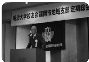
矢谷福岡市地域支部長のご挨拶

当日は福岡市地域支部所属の校友だけでなく、福岡県父母会や大牟田、久留米、小倉、八幡の各地域支部からの来賓など、約100名がご参加されました。