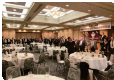
参加者全員による校歌斉唱・エール三唱