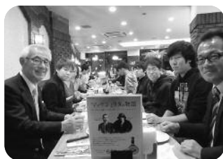
佐々木県支部長と記念撮影