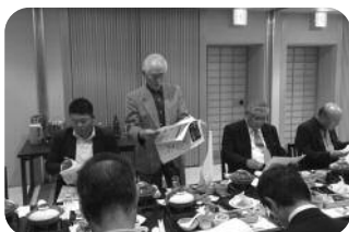
明治大学本校近況報告