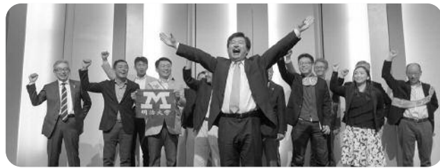
参加者全員での校歌斉唱・エール三唱