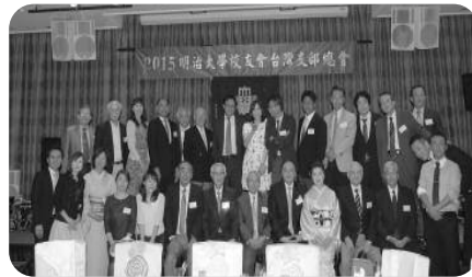
総会終了後、福岡校友全員で

驚いたのは、全出席者一人一人の紹介が司会者より行われたこと、スペシャル抽選会で当選景品の他に現金を渡されていた