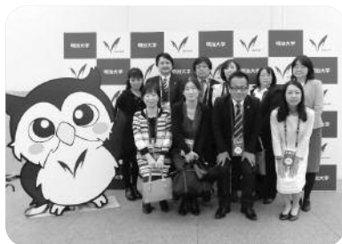
緒方会長と役員さんによる記念撮影

父母会は、リハビリホール担当係として佐賀県父母会・長崎県父母会とともにニューウェーブ、ビッグサウンズ、北之台