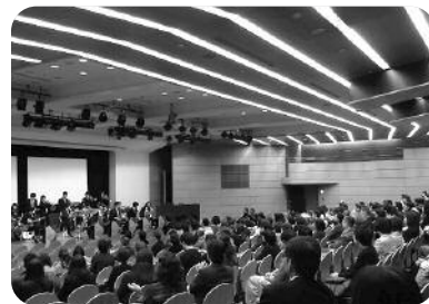
父母交流会会場内の様子

雅楽アンサンブルの出演時間の微調整・会場内での案内誘導・会場セッティング・入場状況等の連絡対応をするとともに、空き時間には各行事に参加しました。