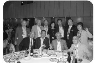
懇親会福岡コーナーでのみなさんの様子

今回の全国大会には56支部の全ての支部から登録があり、県外からの参加者が1,100名になる盛会でありました。滋賀県支部の校友数は654名と多くはないが近畿地区の5府県支部が大会支援委員会を組織するなどの協力で大会が無事に開催されたのはまさしく「明治は一つ」の表れだと感じました。全国大会は2016年の鳥取、そして沖縄・石川・千葉・香川と予定されていますので皆様方も是非ご参加下さい。