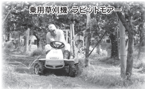
乗用草刈機・ラビットモアー