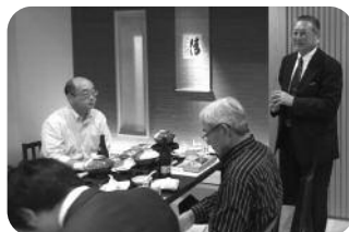
安永校友による乾杯のご挨拶