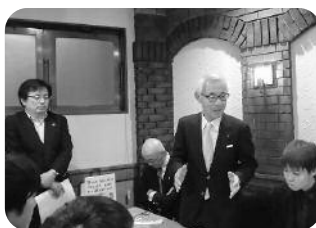
佐々木県支部長のご挨拶