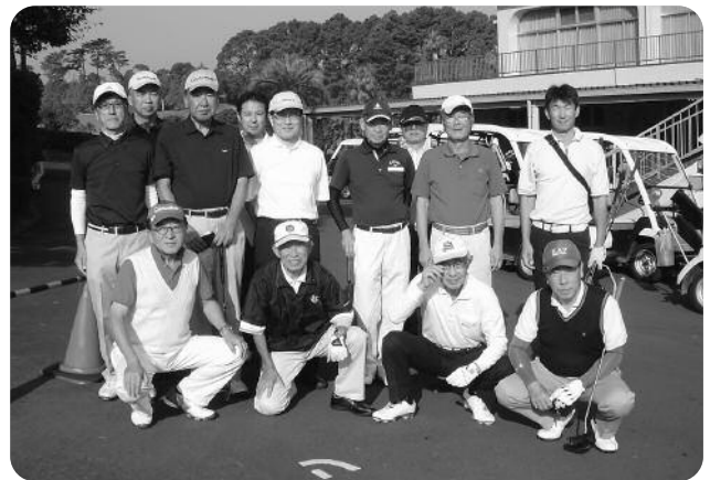
参加者全員で記念撮影