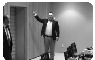
片岸校友によるエール三唱