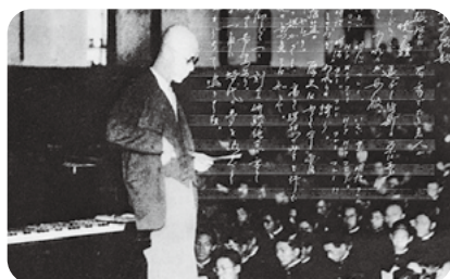
記念講堂で指揮を執る山田耕筰