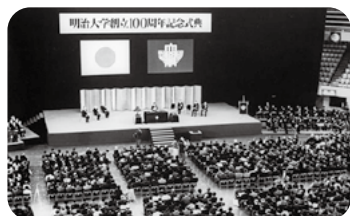
1980年代の駿河台記念館と和泉キャンパス風景