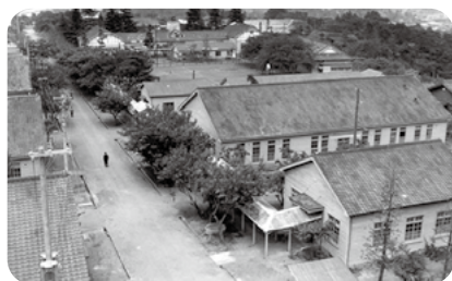
1950年代の生田キャンパス